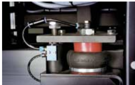
Un exclusivo sistema de suspensión neumática de cuatro puntos asegura una filmación precisa.

Cada sistema :Polaris X está basado en la sólida fiabilidad de Agfa polaris, que ya es la solución de ordenador a plancha líder del mercado para periódicos, y añade nuevas y extensas prestaciones y características de diseño avanzado. Resultado: la gama :Polaris proporciona una fiabilidad excepcional y un alto nivel de automatización para reducir el coste total de operación. Si equipa su sistema :Polaris X con un cabezal láser violeta, podrá reducir incluso más el coste de sus operaciones, puesto que este láser de larga duración está diseñado para durar tanto como el sistema, eliminando así la necesidad de una costosa sustitución de los cabezales láser térmicos.